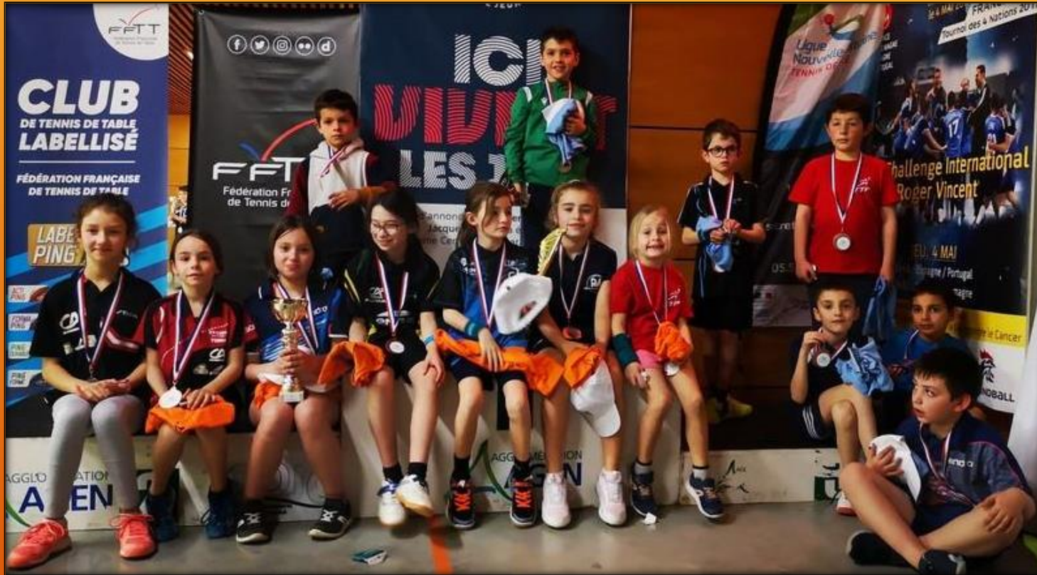
Médaillés top de détection régional 2022