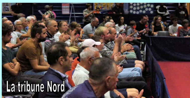
La tribune Nord